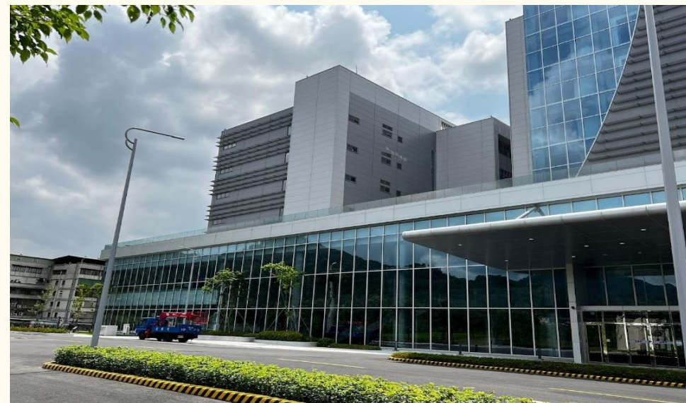
寶高智慧產業園區